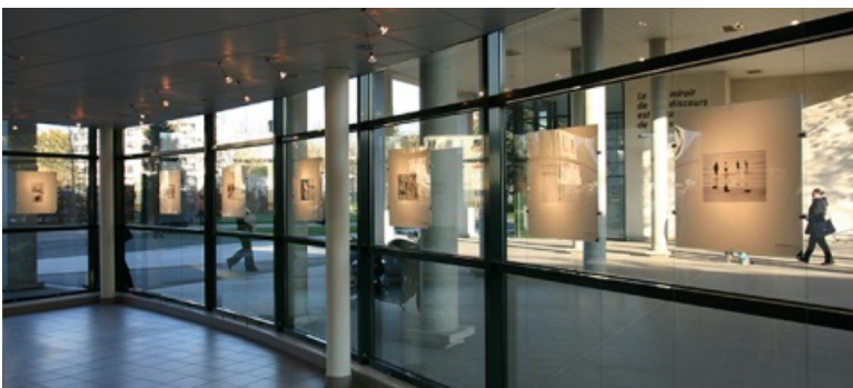
Exposition à la Chambre claire

La Chambre Claire (hall du Bât. P) accueille plusieurs expositions par an. Assurée par le service culturel, sa programmation présente en priorité des projets photographiques, mais aussi de la gravure, du dessin... Les vernissages sont ouverts à tou-te-s et sont l'occasion de rencontrer les artistes et d'échanger sur les œuvres.