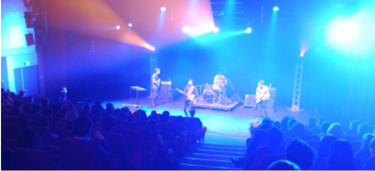
Concert au Tambour

Auditorium de 297 places (dont 50 strapontins), le Tambour est un espace de diffusion culturelle situé à l'entrée du campus Villejean. Inauguré à la rentrée 1997, il est un des lieux clés de la vie culturelle de Rennes 2 et de la ville de Rennes. Tout au long de l'année universitaire, il accueille une programmation de concerts, de spectacles vivants, de conférences et de projections. Sa proximité avec le métro en fait un lieu accessible et ses événements sont ouverts à tou-te-s.