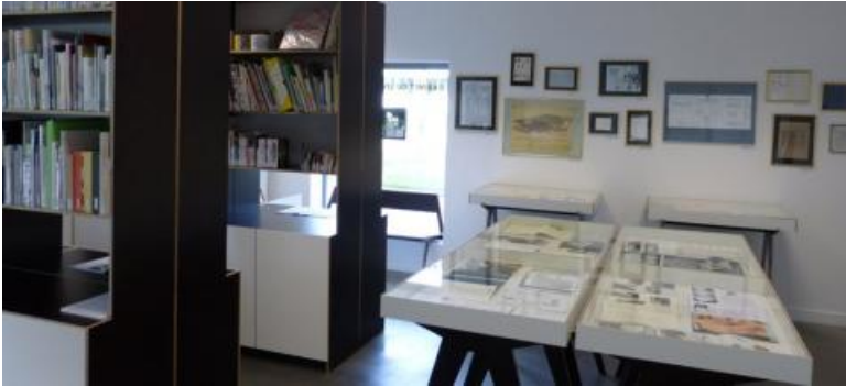
Cabinet du livre d'artiste

Le cabinet du livre d'artiste (CLA), situé au rez-de-chaussée du bâtiment Érève, est à la fois une bibliothèque spécialisée et un lieu d'exposition : près de 4000 titres y sont disponibles à la libre consultation et au prêt, et un programme d'expositions consacrées à l'imprimé est proposé tout au long de l'année. La création du Cabinet du livre d'artiste a été initiée par les Éditions Incertain Sens , programme de publications et de recherche autour du livre d'artiste. Lieu de diffusion de l'imprimé auprès d'un public non spécialisé, le CLA est membre de l'association Art contemporain en Bretagne et bénéficie de la collaboration du Frac Bretagne et de l'École des Beaux-Arts de Rennes.