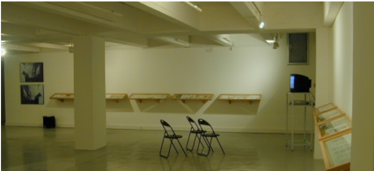
La Galerie Art & Essai organise 4 à 5 expositions par an.

Située sur le campus Villejean, sous la bibliothèque universitaire, la Galerie Art & Essai de l'université Rennes 2 est un lieu d'exposition et de diffusion de la scène artistique contemporaine. Ses missions pédagogiques complémentaires à la formation et à la recherche s'accompagnent de rencontres et de discussions avec tous les publics. Placée sous l'égide du service culturel, la galerie organise quatre à cinq expositions par an, avec des projets monographiques ou collectifs confiés à des commissaires invités. La Galerie Art & Essai fait partie de l'association Art contemporain en Bretagne .