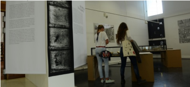
Exposition de livres anciens à la bibliothèque centrale, campus Villejean.

Dans la bibliothèque universitaire centrale, des manifestations culturelles (expositions, rencontres...) sont régulièrement organisées pour animer les lieux et valoriser les collections. Ces rendez-vous s'adressent à la communauté universitaire et au grand public.