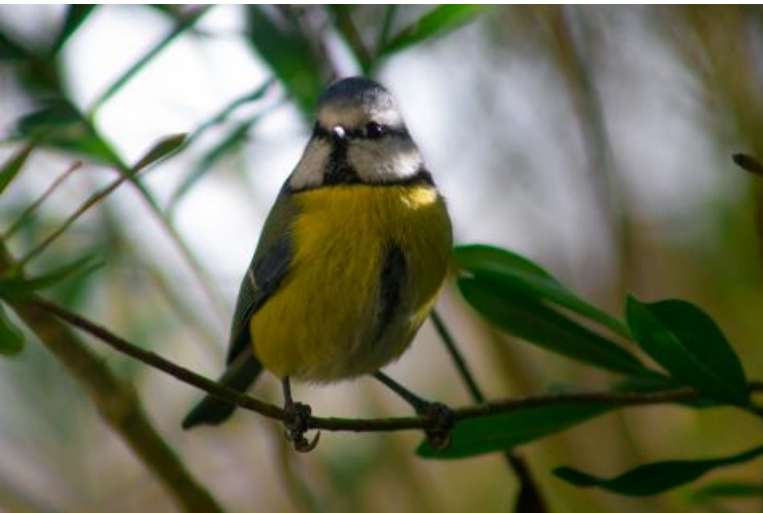
Photo de Sébastien Chala, étudiant en 2 e année du master NUMIC Crédit : Sébastien CHALA - Photographe colombien

Cliché pris à la froide mais charmante campagne de Mongui, en Colombie.