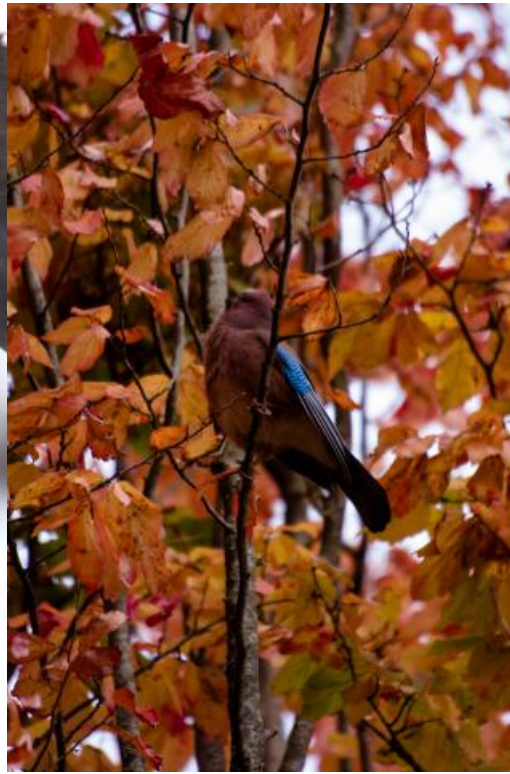
Photo d'Alice Miras, étudiant en L1 de psychologie et en L2 de sociologie à Rennes 2. Crédit : @malice1905

Pris au réveil à Madagascar, intrigué par l'appareil mais surtout attiré par le petit déjeuner.